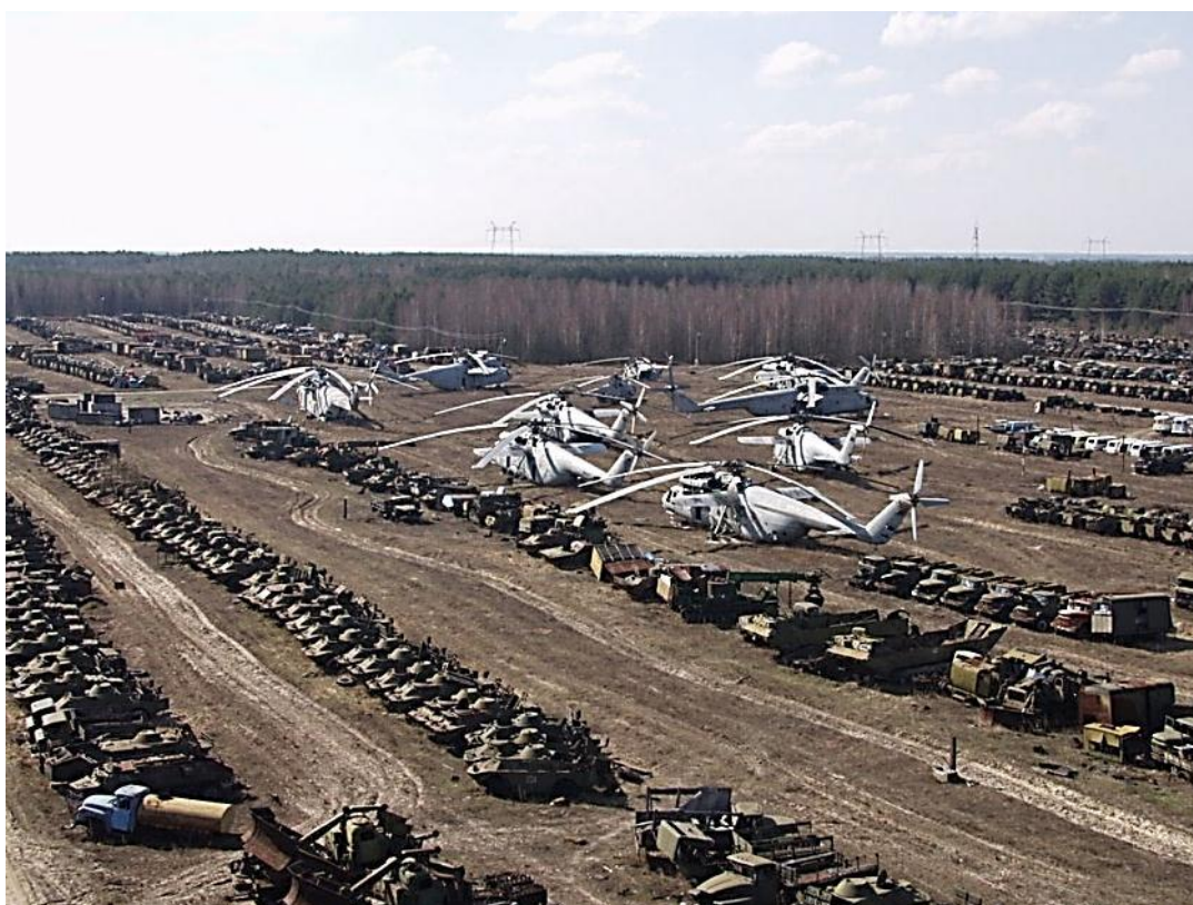
Кладбище военной техники, использовавшейся при ликвидации аварии