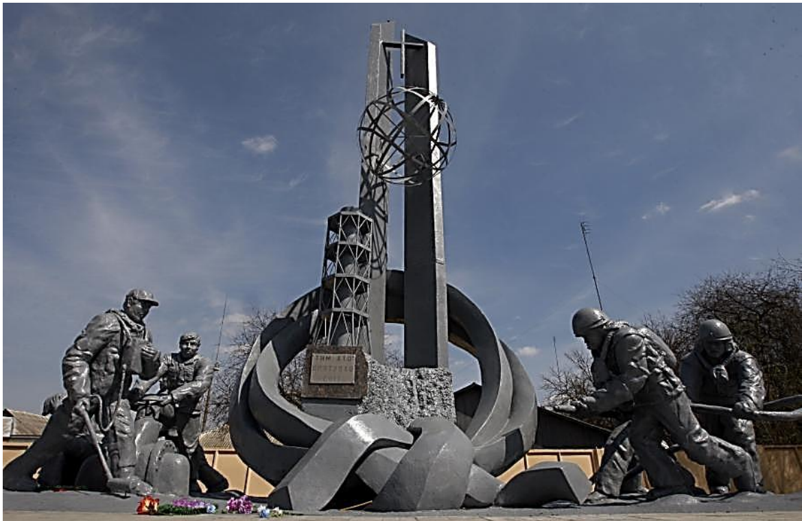
Монумент ликвидаторам аварии на Чернобыльской АЭС «Тем, кто спасал мир»