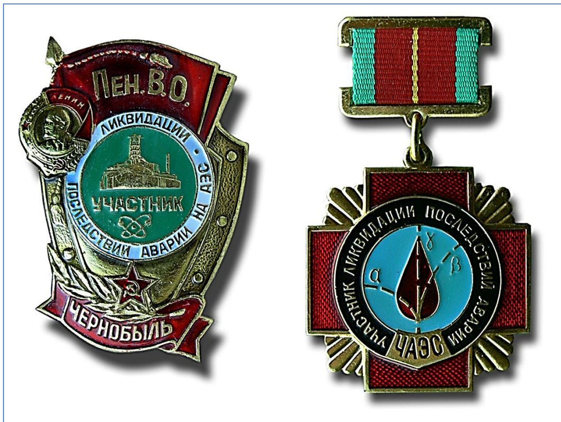
Знаки участника ликвидации аварии на Чернобыльской АЭС