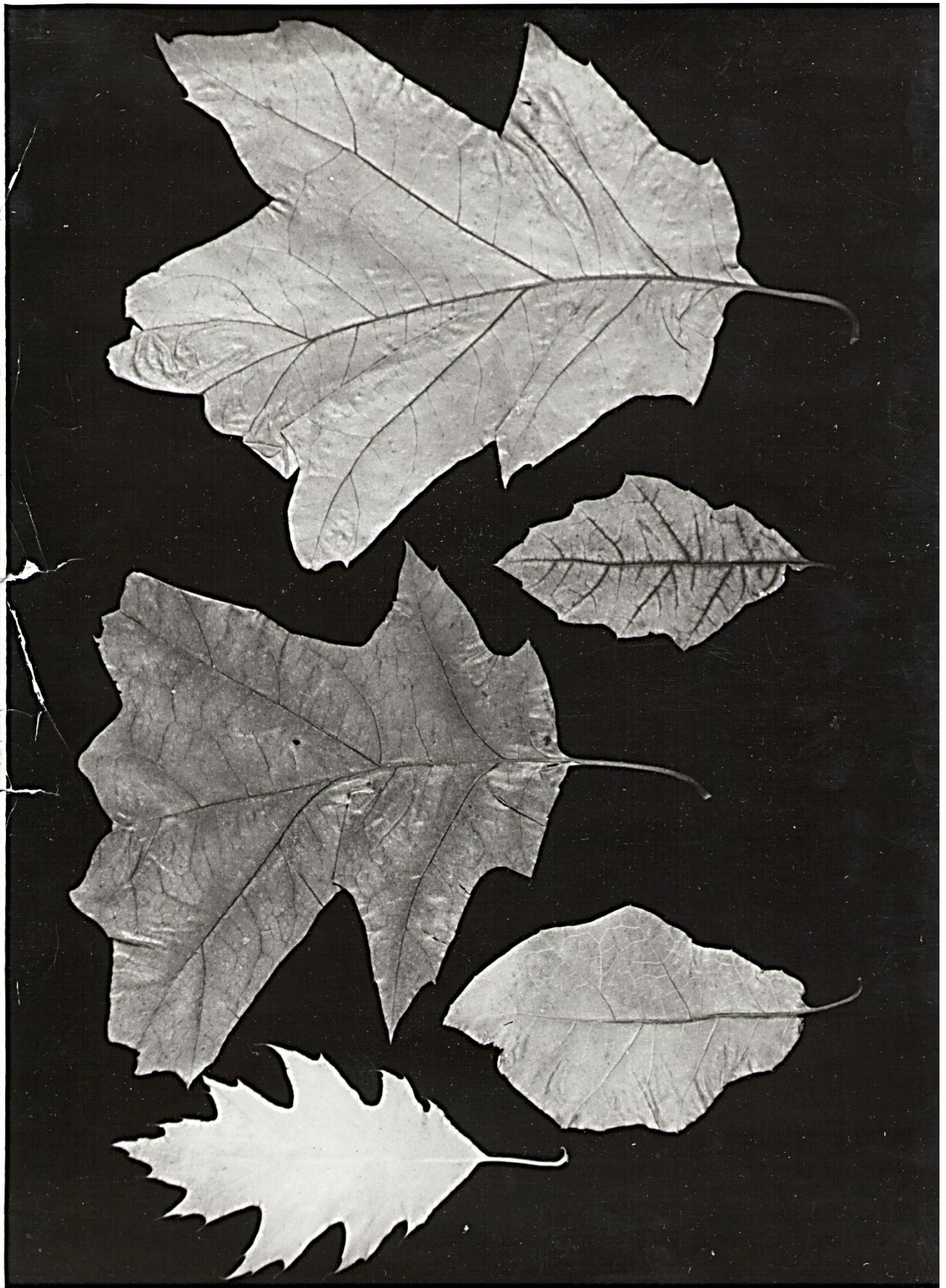
Мутация листьев дуба