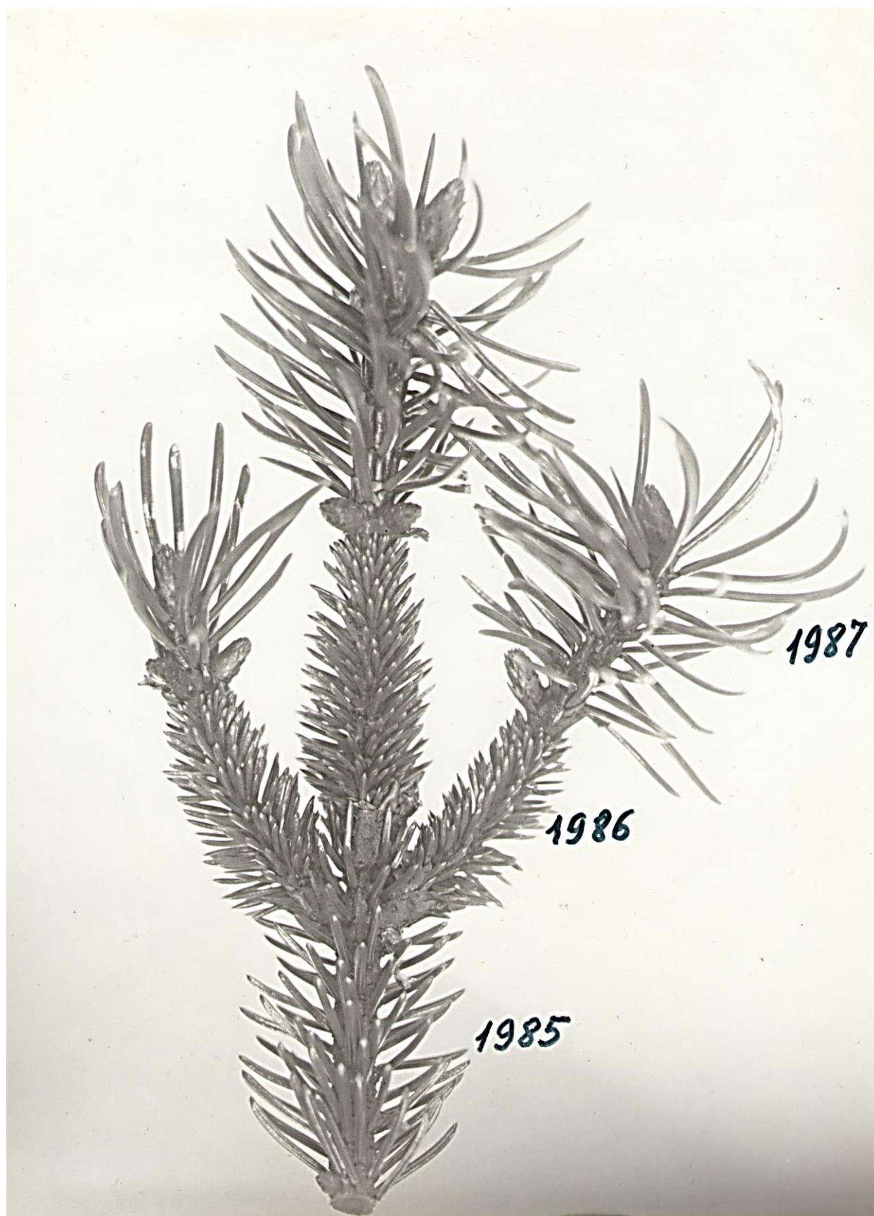
Мутация хвои ели