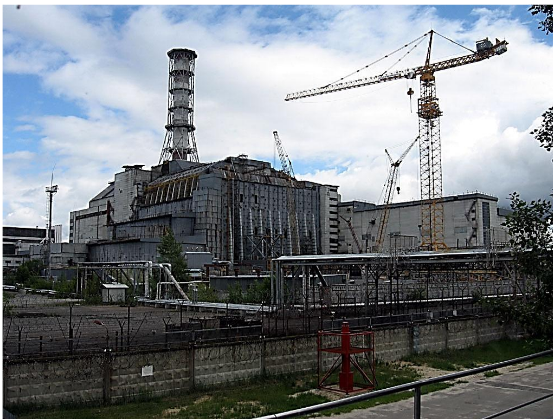
Строительство саркофага над четвертым энергоблоком